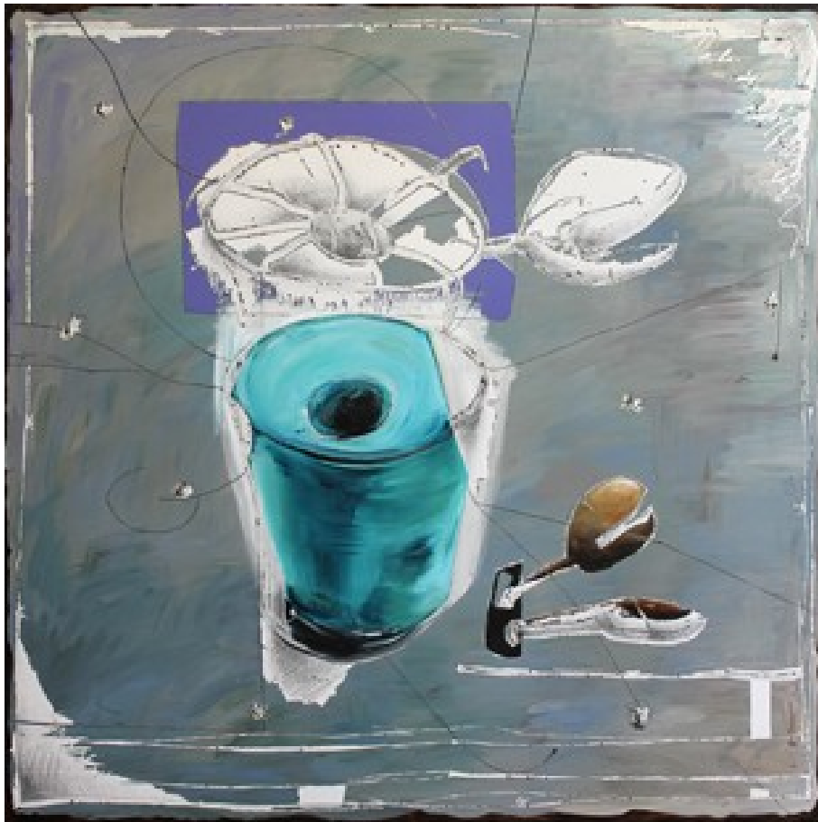
„Tarnkappe“ (200 x 200 cm)

Meine Bilder sind Schichtungen. Die letzte sichtbare Oberfläche soll auf ein geheimnisvolles unsichtbares Darunter verweisen. Die Bearbeitung der Leinwand führt zu taktilen Referenzen. Ich bringe Grafisches und Malerisches in einen Dialog und verweise über vordergründige Farbsignale auf leisere, schnell zu übersehende Elemente. Das imaginäre visuelle Öffnen der Oberfläche bringt neue Bildzusammenhänge hervor, baut neue Räume auf. Bei meinen Bildern soll das Fließende und Prozessuale erlebbar werden. Zwischen den einzelnen Schichten entwickeln sich neue Bezüge, Spannungen, Ordnungen und Unordnungen, Muster, Verhältnisse und Missverhältnisse.