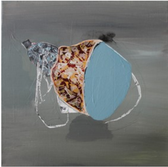
„Ladung“ (30 x 30 cm)