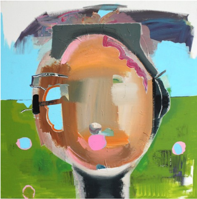
„Flunkerei“ (80 x 80 cm)