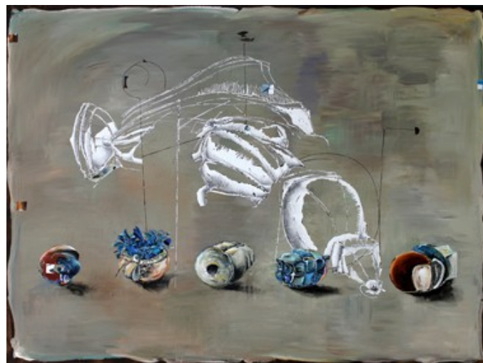
„Zutaten“ (150 x 200 cm)