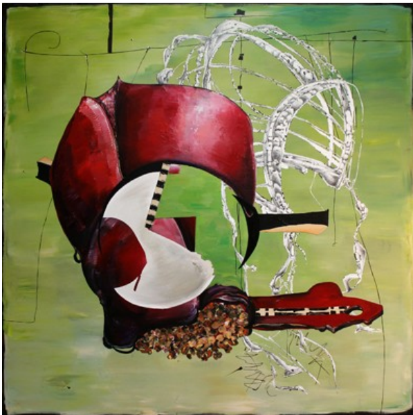
„Behütung“ (180 x 180 cm)