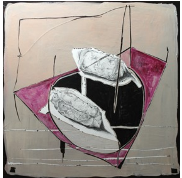
„Teilchen“ (21 x 21 cm)