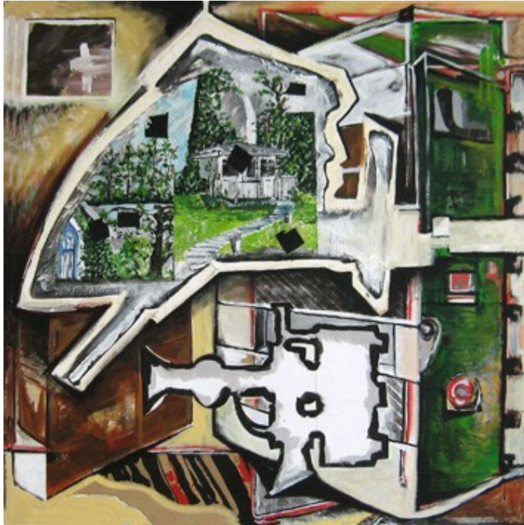
„Fokus“ (80 x 80 cm)