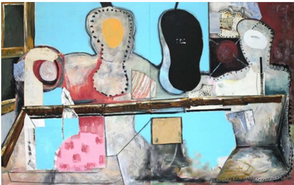
„Phantom“ (100 x 160 cm)