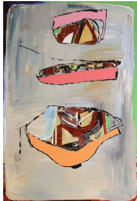
„Gemischtwaren“ (120 x 80 cm)