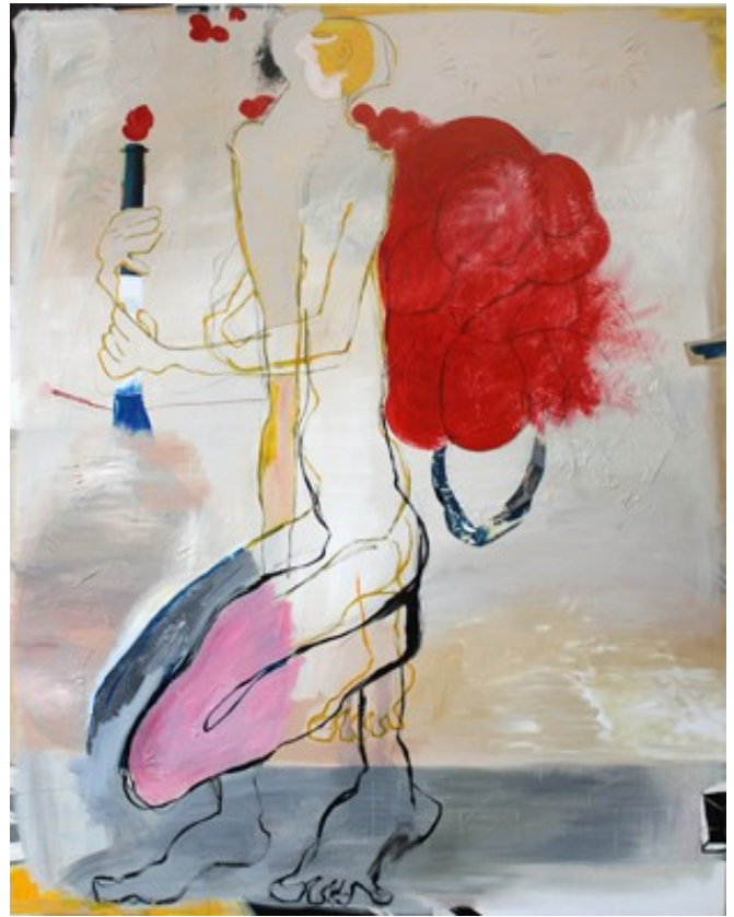
„Kokolores“ (180 x 140cm)