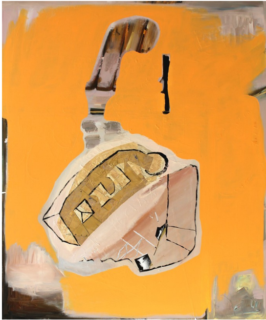
„Klunker“ (120 x 100cm)