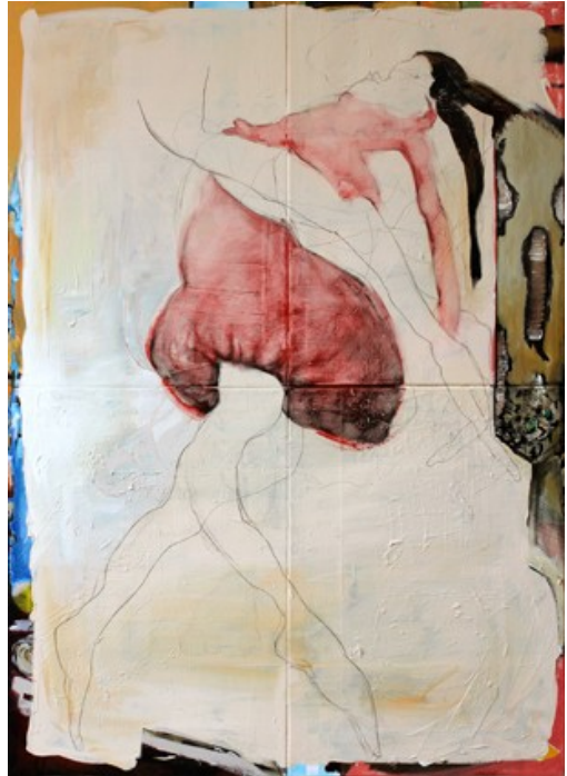
„Leichtigkeit“ (140 x 100 cm)