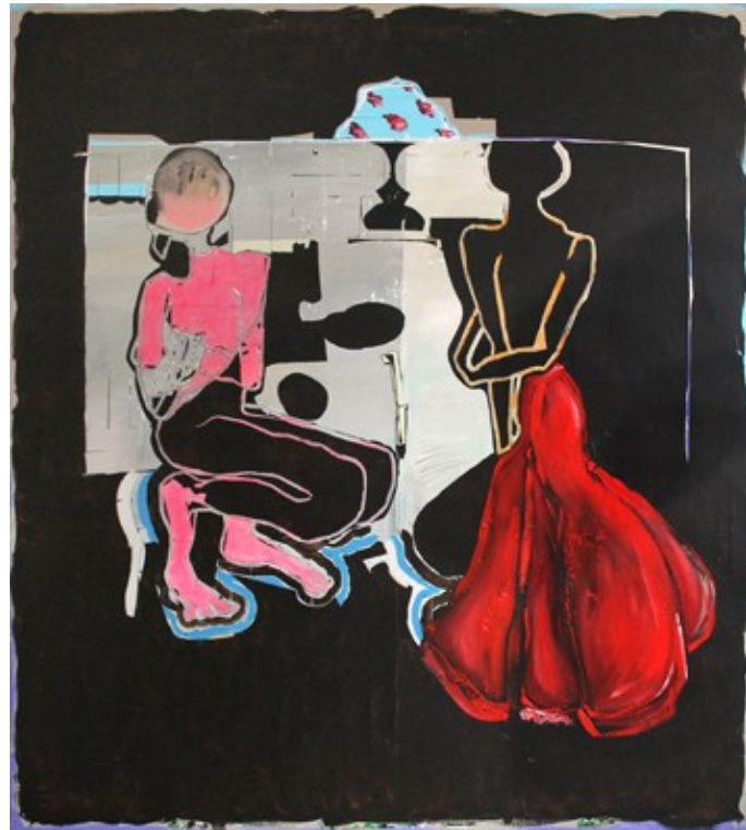
„Kompars“ (200 x 180 cm)