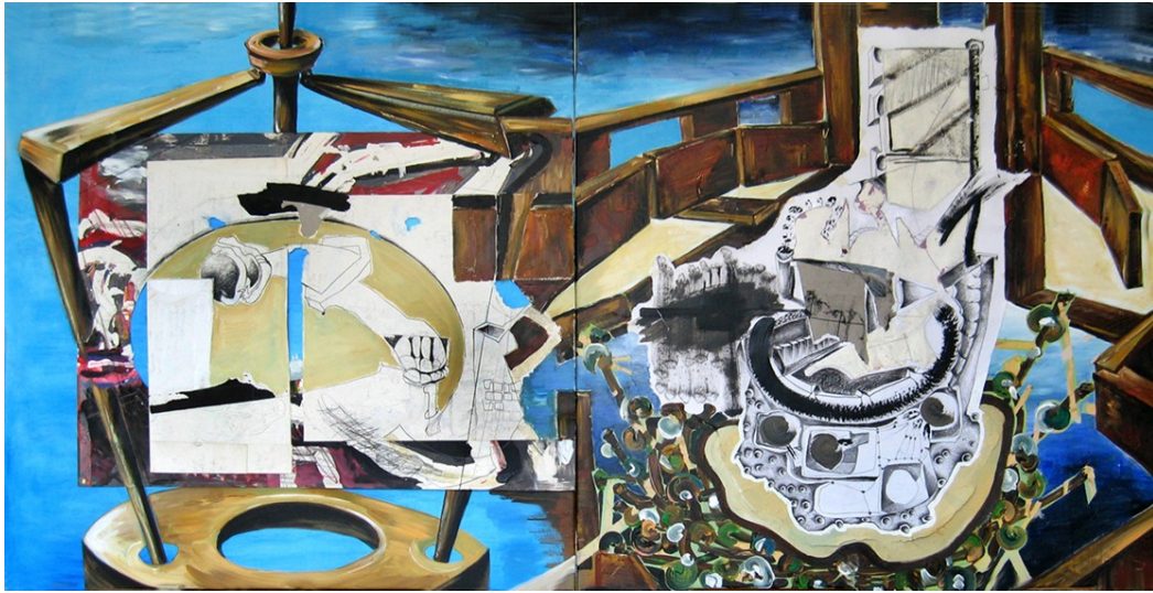
„Ahoi“ (100 x 200 cm)

Der Beginn ist meistens eine Zeichnung auf Papier, dann wähle ich einen interessanten grafischen Akzent aus und verleime ihn auf der Leinwand. Diese beschichte, reserviere und übermale ich so lange bis die gefundenen Zeichen ein Ganzes geworden sind und eine geheimnisvolle Bedeutung besitzen. Das Verweben von Handzeichnung und Malerei, das Kombinieren von bereits bewertetem Papier und Leinwand soll Verfremdung und Dingreiz steigern. Das Entstehen mehrerer in sich verschränkter Ebenen ist erwünscht. Inhaltlich und handwerklich-formal sollen die Bilder Freiräume für verschiedene Sichtweisen öffnen.