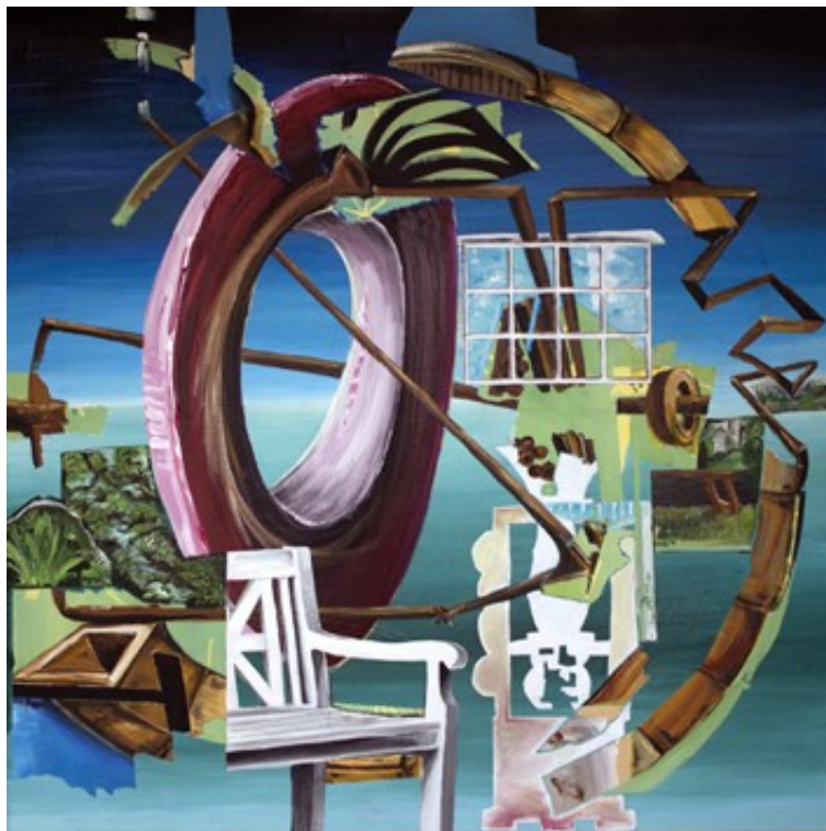
„Unruhestifter“ (100 x 100 cm)