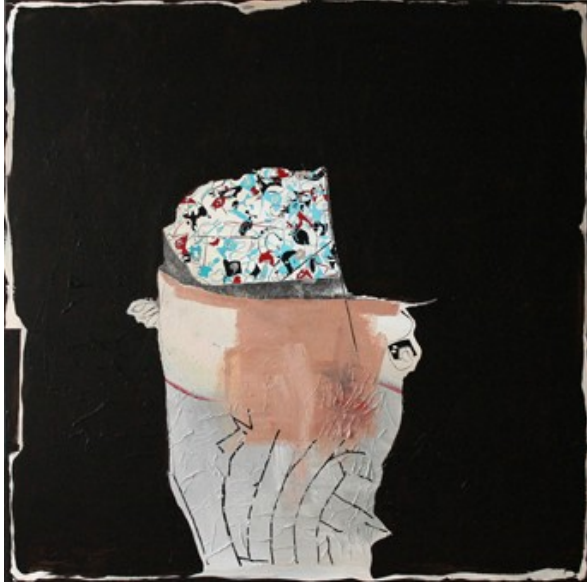
„Ausgrabung“ (100 x 100 cm)

(Mischtechnik auf Leinwand und Papier: Acryl, Bleistift, Buntstift)