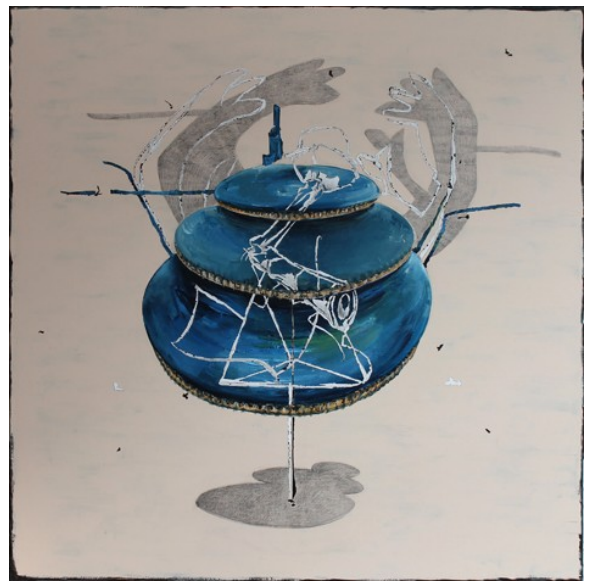
„Fingerspitzengefühl“ (100 x 100 cm)