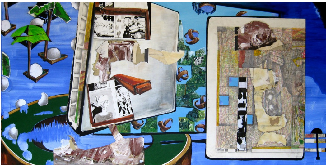
„Stückgut“ (100 x 200 cm)