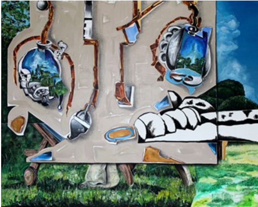
„Störung“ (160 x 200 cm)