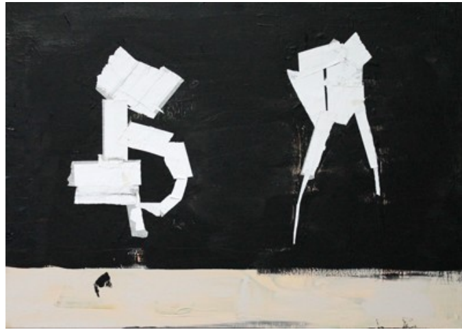
„Duo“ (50 x 70 cm)