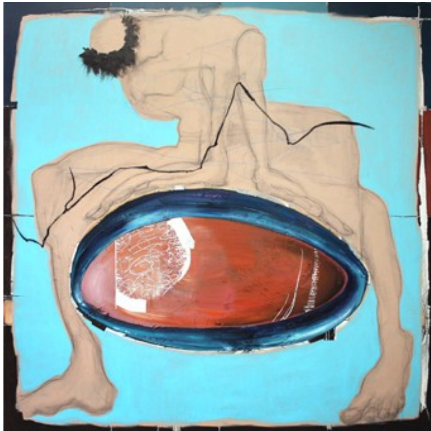
„Überwindung“ (170 x 170 cm)