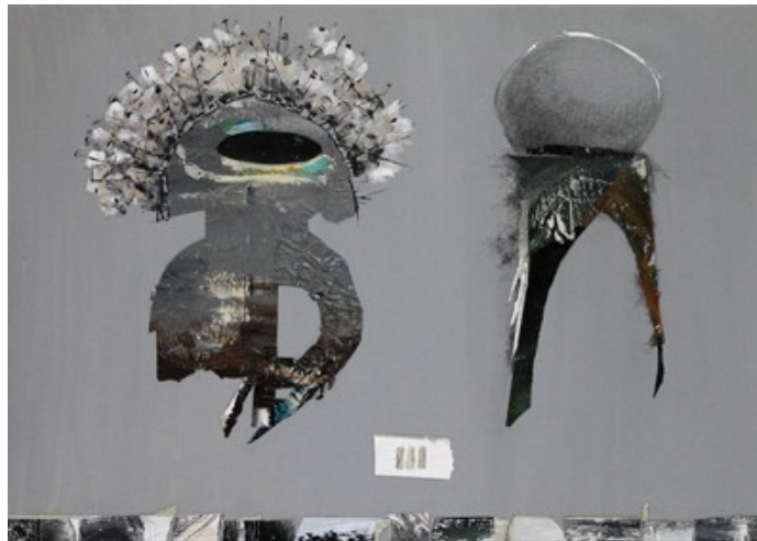
„Einfaches Doppel“ (50 x 70 cm)