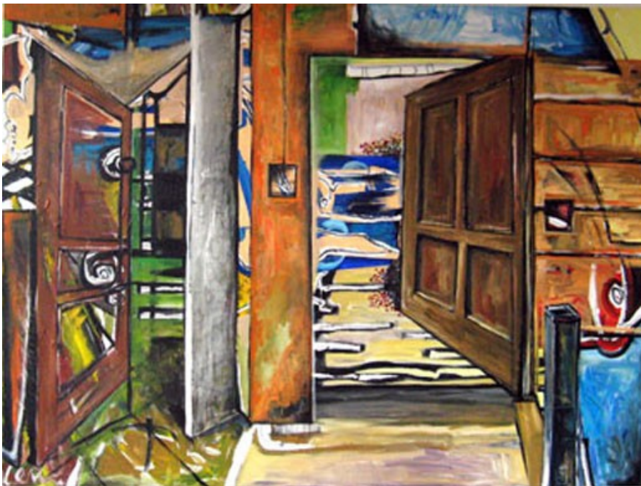
„Eingang“ (120 x 160 cm)