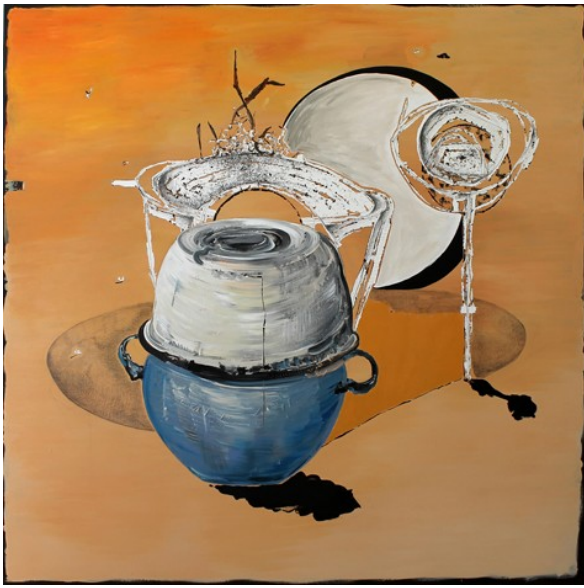
„Feinkost“ (160 x 160 cm)