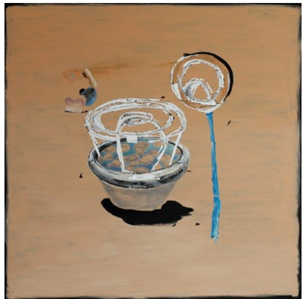
„Schwarm“ (100 x 100 cm)