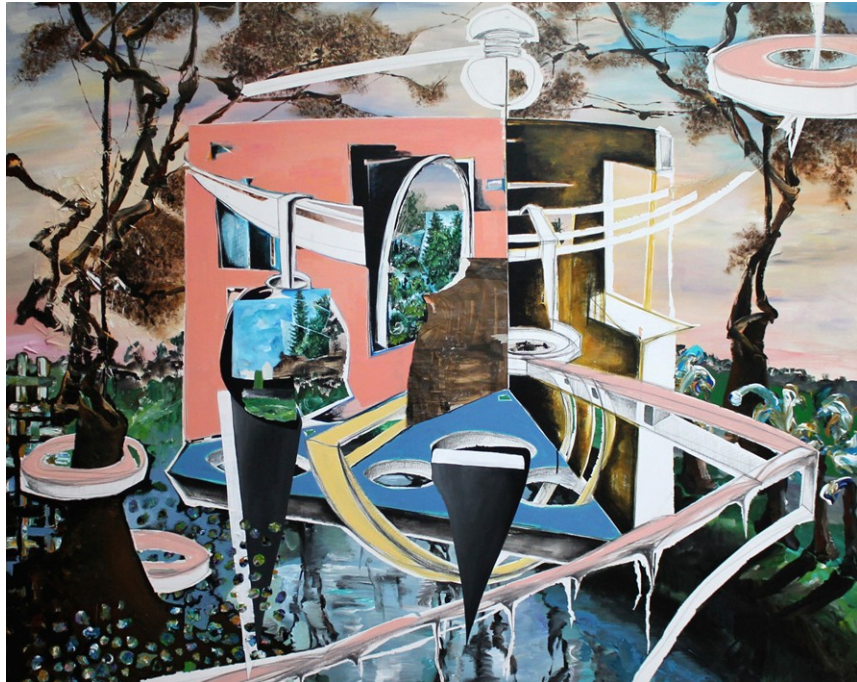
„Versteck“ (160 x 200 cm)