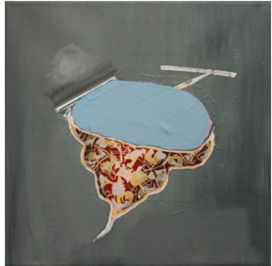
„Vorwand“ (30 x 30 cm)