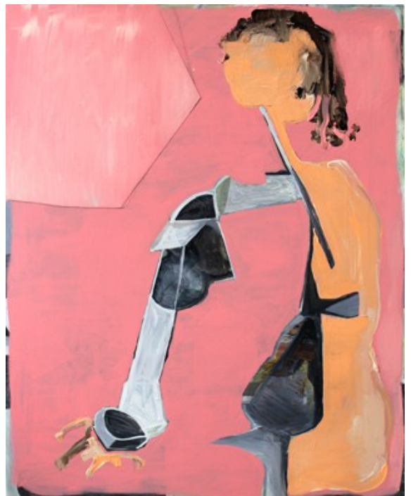
„Anmut“ (100 x 80 cm)