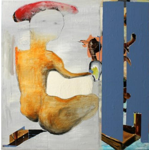
„Rätsel“ (120 x 100 cm)