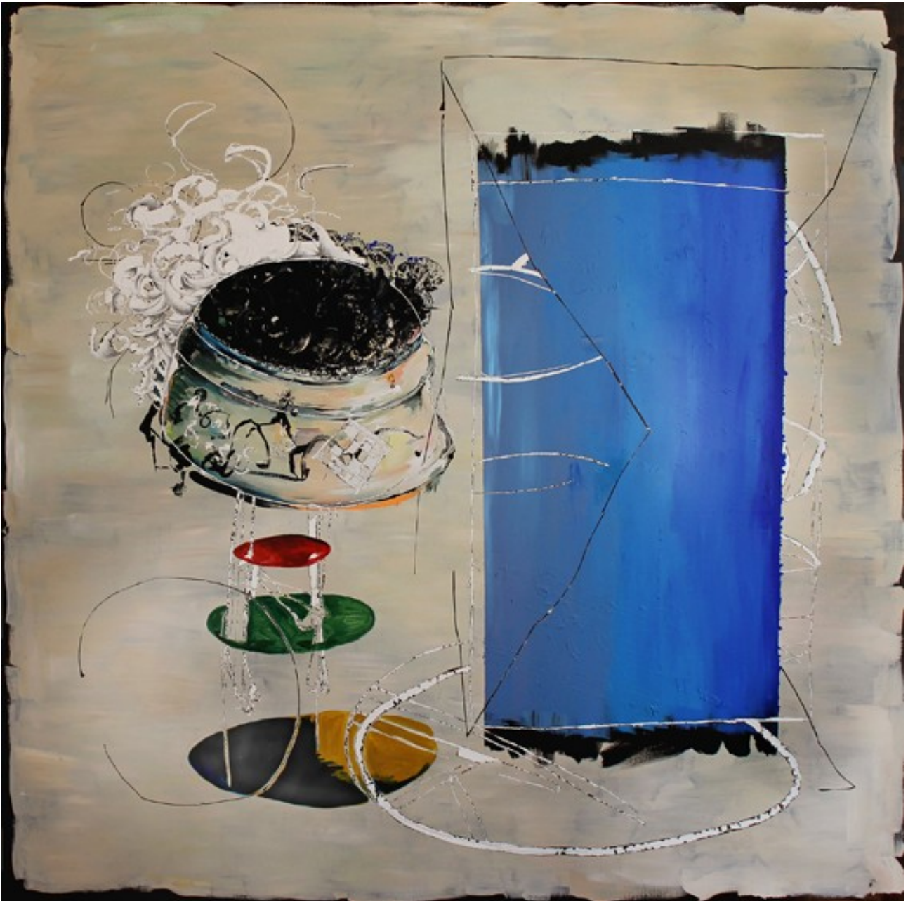
„Hula Hupp“ (200 x 200 cm)