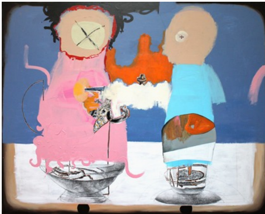
„Verführung“ (170 x 170 cm)