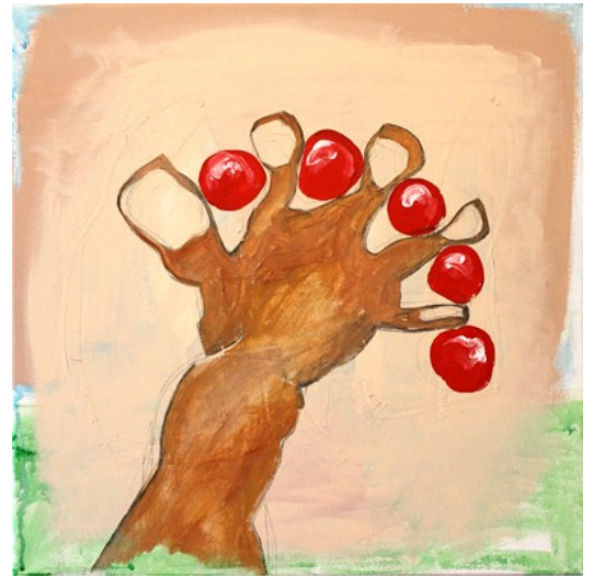
„Geduld“ (50 x 50 cm)