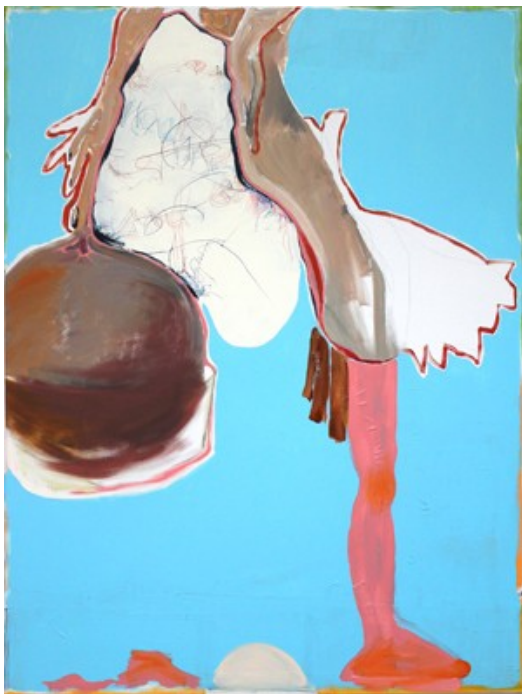
„Rückhalt“ (160 x 120 cm)