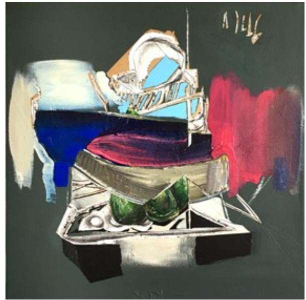
„Akku“ (50 x 50 cm)