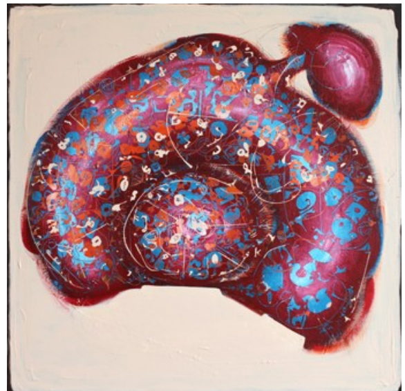
„Rundherum“ (60 x 60 cm)