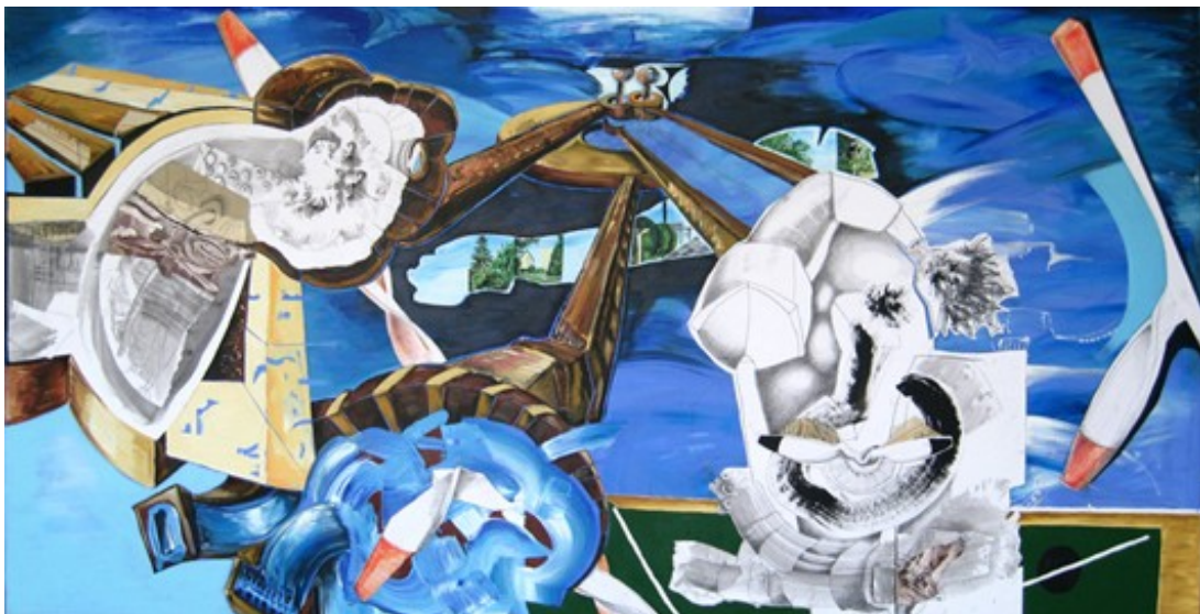
„Strudel“ (100 x 200 cm)