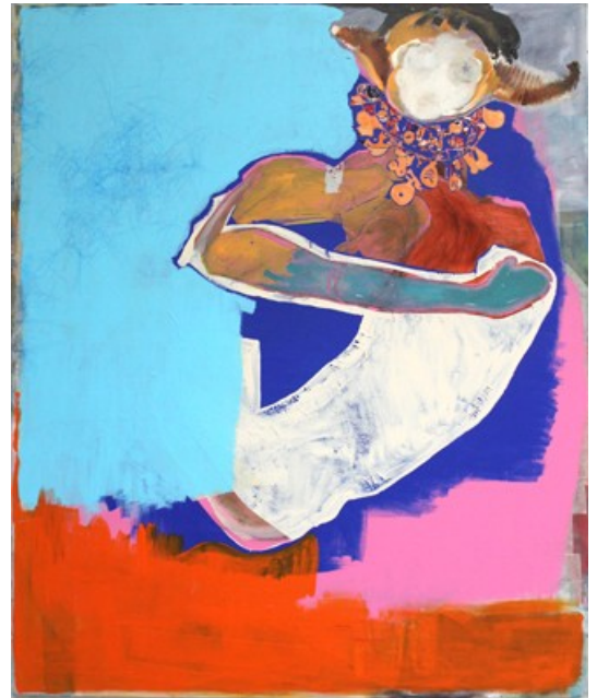
„Stubenhocker“ (120 x 100 cm)