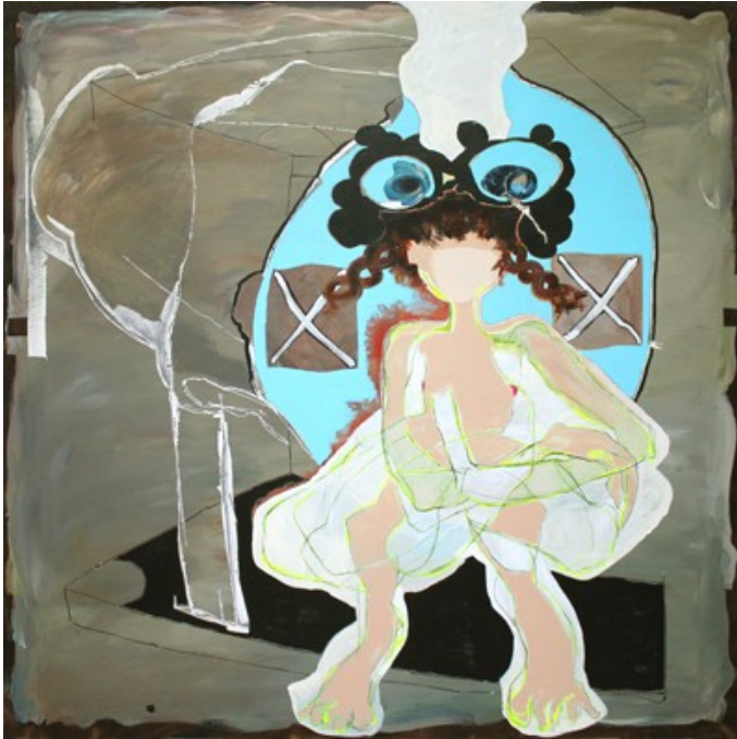
„Klimbim“ (200 x 200 cm)