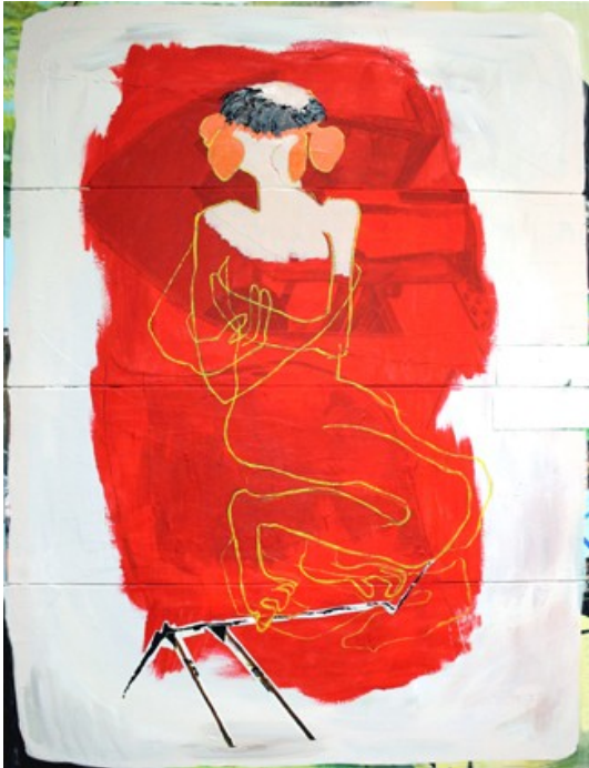
„Karma“ (200 x 150 cm)