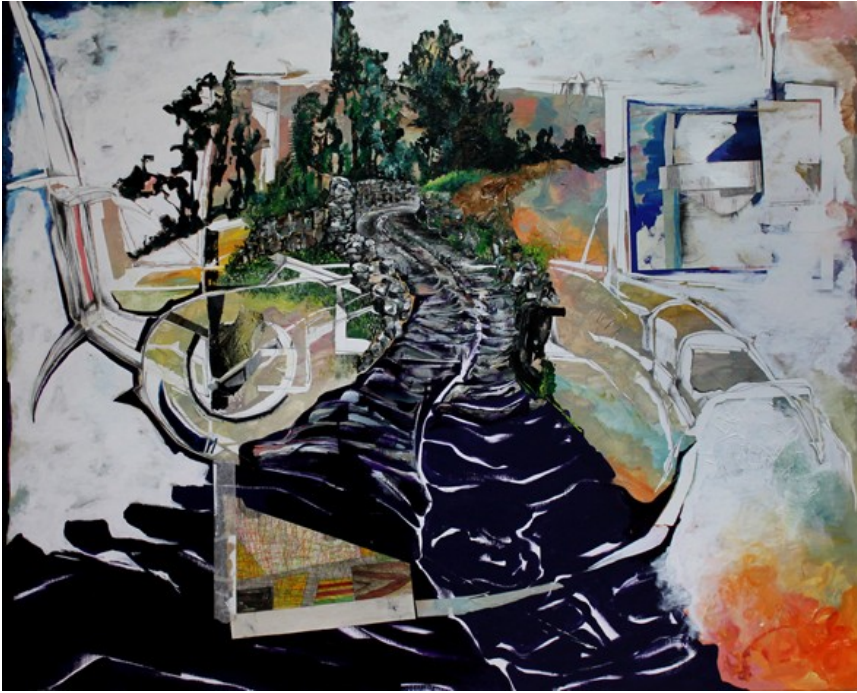
„Pfadfinder“ (160 x 200 cm)