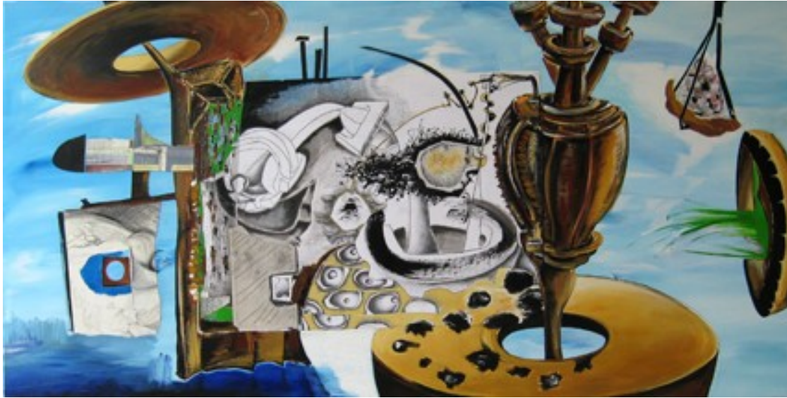
„Seeluft“ (100 x 200 cm)