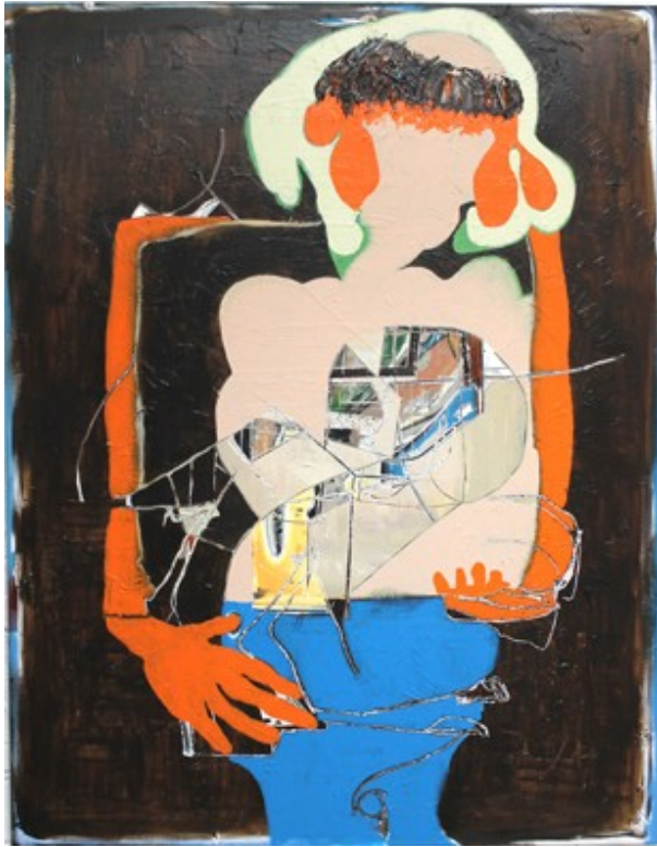
„Verteiler“ (180 x 140 cm)