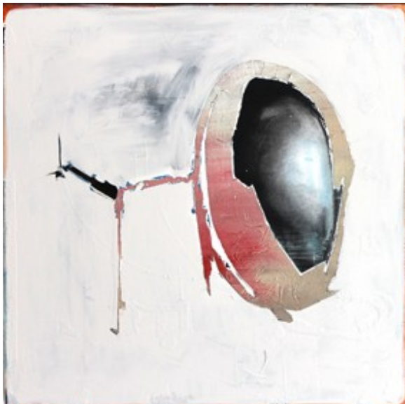
„Verborgeneheit“ (60 x 60 cm)