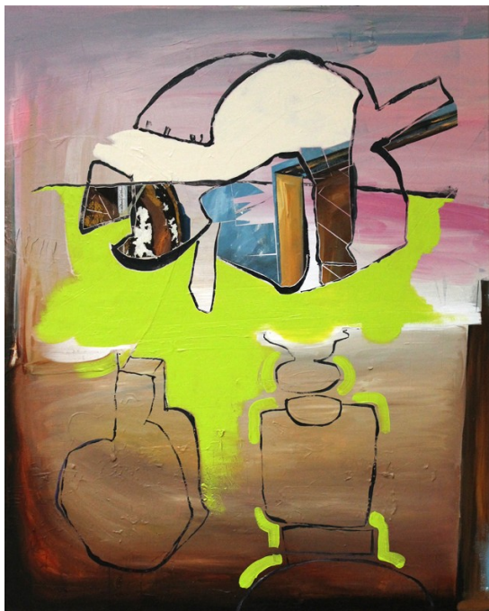
„Stolperstein“ (100 x 80 cm)